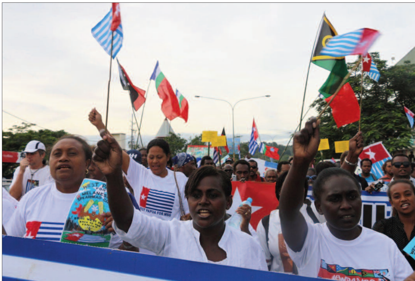
Massale ondersteuning bevolking Solomon Island toelating ULMWP tot MSG - Juni 2015.

putty. Dat verloopt vrij soepel. Het probleem is de samenwerking met Molukkers buiten Maluku, oftewel hier in Nederland. West Papua kan Maluku alleen ondersteunen als er sprake is van eendracht. Beide partijen moeten samenwerken, gedragen door het volk op de Molukken, om toegelaten te worden tot de MSG in 2017. Om de 2 jaar wordt een MSG Summit gehouden. Mocht het Maluku deze keer niet lukken dan heeft het in 2019 nog een laatste kans voor de deadline van 2020. Het maakt niet uit of het langzaam of snel gaat, het gaat er om dat je er komt.