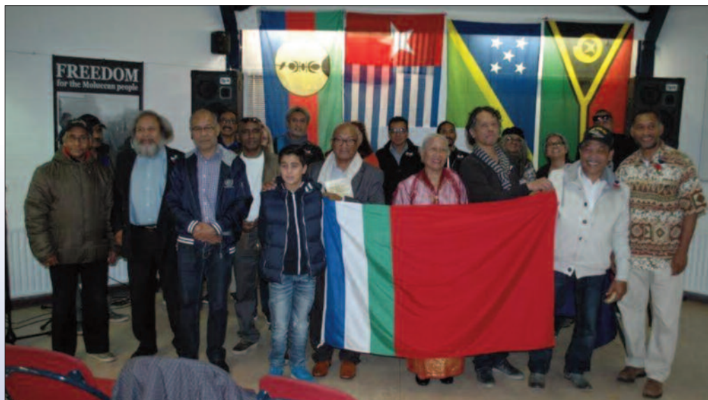
Groepsfoto Informatiebijeenkomst 7 november 2015, Stg. Lawa Mena Twello.

“Afgelopen juni vond de Melanesian Spearhead Group Summit oftewel de MSG Top plaats. De ontmoeting is een intergouvernementele organisatie waarin vijf Melanesische landen zijn vertegenwoordigd, namelijk: Solomon Islands, Papua New Guinea, Fiji, Vanuatu en New Caledonia. Van drie verschillende onafhankelijke, West Papua politieke organisaties werden er vijf leiders gekozen om hun land te vertegenwoordigen tijdens de MSG Top, w.o. Jacob Rumbiak van Federal Republic of West Papua. Samen vormen zij de United Liberation Movement of West Papua (ULMWP). ULMWP streeft er naar om als West Papoea deel uit te maken van de MSG Top om zo politieke erkenning te krijgen. Hierdoor zou West Papoea een onafhankelijke stem hebben en de mogelijkheid krijgen om hun Melanesische, d.w.z. niet-Indonesische, identiteit onder de internationale pu-