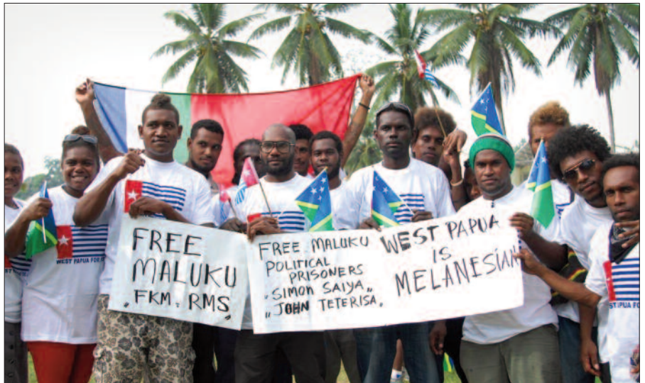
Studenten in Honiara – Solomon Islands Support RMS –FKM – juni 2015.

en Molukse klederdrachten gekleed. In 2004 kwamen 54 Molukse bootvluchtelingen aan in Australië. Met hen had ik gehoopt dat wij samen in Australië iets voor de Molukken kunnen betekenen. Helaas. Uiteindelijk hebben van die groep 15 Molukkers zich blijvend in Australië gevestigd. Ze hebben hun Australische paspoorten en verblijfsvergunning ontvangen, zijn intussen getrouwd en hebben in Melbourne een goed leven opgebouwd. Ze maken zich druk om hun maatschappelijke status en hebben nauwelijks of geen interesse voor de Molukken. Het is heel jammer dat na een vreselijk iets als een burgeroorlog er uitgerekend van die 15 Molukkers geen follow-up was om de weg te openen. Geen inspanning als Molukkers die buiten de Molukken leven.”